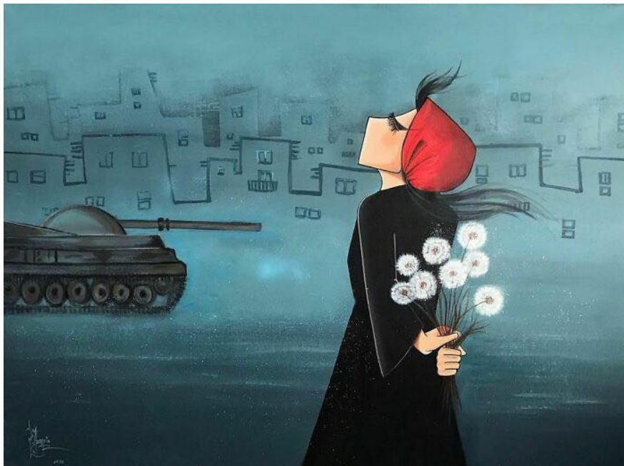
Shamsia Hassani -Afghanistan- femme street artiste